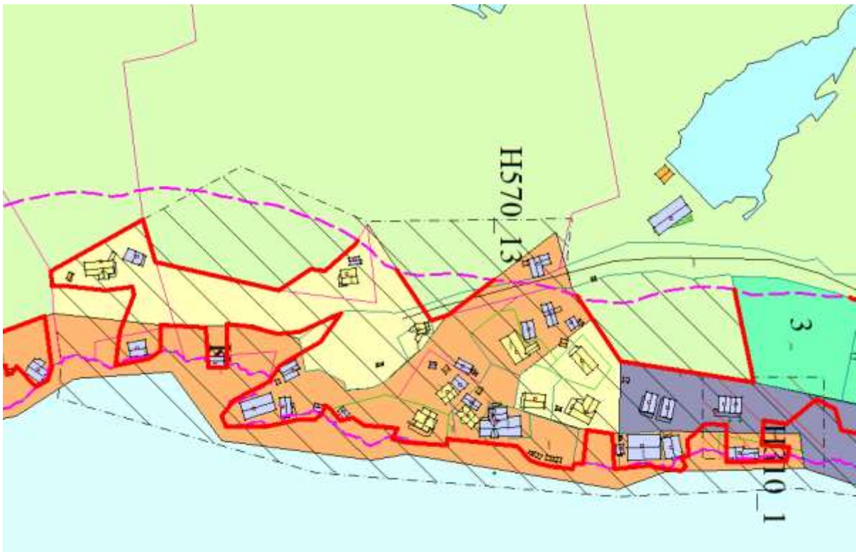
Figur 3 - Byggjegransa følg utbyggingsfremålet i bakkant og opp til 100-metersbeltet. Raud strek er byggjegransa, og rosa strek er 100-metersbeltet.