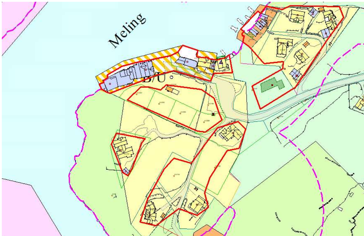
Figur 1: Byggjegrensa er ein slutta ring og det er tillat med bygging innanfor denne. Raud strek er byggjegrensa, og rosa strek er 100-metersbeltet.

Eit par plassar føl byggjegrensa utbyggingsføremåla også i bakkant og opp til 100-meterbeltet (Figur 3). Byggjegrensa opnar då for tiltak på den sida det er utbyggingsføremål og ikkje LNF-føremål.