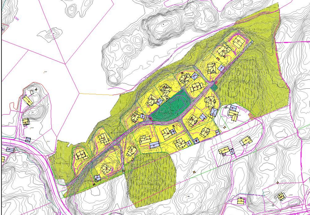
Figur 1: Reguleringsplanen for Bjørkåsen (R-92) viser areal for einebustadar, leikeareal, friluftsområde, vegareal og renovasjonspunkt.

Eksempel på generaliseringa av føremål ved oppheving av reguleringsplan: