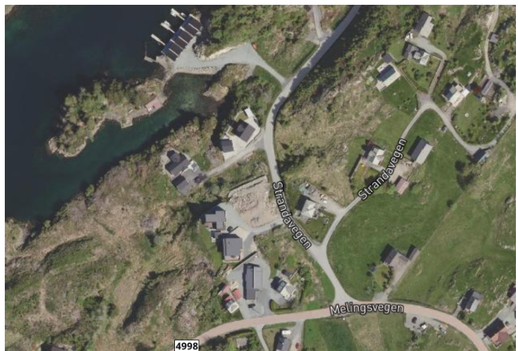
Figur 1 - utsnitt frå plankart (13.08.2024), og flyfoto (2024, kommunekart)