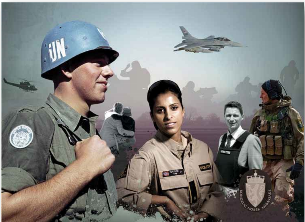
(Bilete frå «I tjeneste for Norge - Regjeringens handlingsplan for ivaretakinge av personell før, under og etter utenlandstjeneste.

Det vert sagt i den nasjonale oppfølgingsplanen at sivil sektor skal ta eit større ansvar for å sikre at den einskilde får den hjelp og støtte som personen har krav på. Det skal bli gitt ein tettare og meir effektiv samhandling i den sivile sektoren - særleg i kommunen.