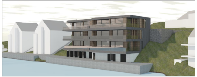
Figur 29 Illustrasjon som syner mogleg utnytting av området

Kommunen bør vurdere om det er behov for supplerande føringar for å sikre reell mogelegheit for at arealet er tilgjengeleg for ålmenta.